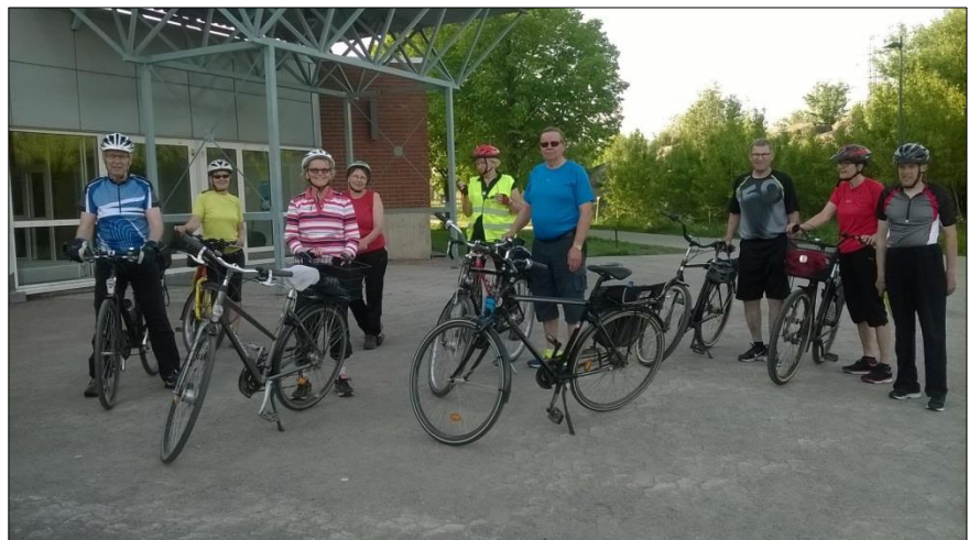
Maanantaipyöräilijät lähdössä 30.5.2016 Kerttulasta.

Tule mukaan tutustumaan lähialueen pyöräteihin ja maisemaan Voimme poiketa läheisiin luontokohteisiin ja näköalapaikkoihin.