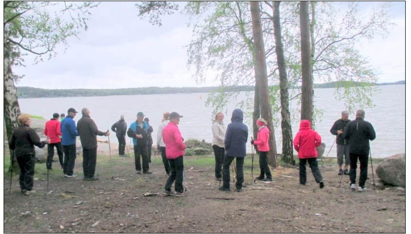
Tiistaikävelijät tauolla 17.5.2016 Hahdenniemen kierroksella

1.11.- 13.12. (ei 6.12) Tasala. Tämän jälkeen kävelyt jäävät joulutauolle.