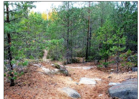
Kangenmieikka syksyllä 2016

Reitin pituus on 8 km ja sen varrella kohtaa myös kauniin suoalueen sekä käärnelähteen.