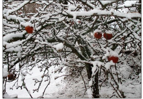
Omenat vilkuttavat Pasalasta!

Vuosi 2017 onkin tavallista juhlavampi, vietämmehän Suomen 100 vuotisjuhlaa koko vuoden.