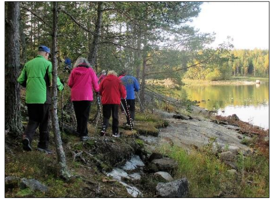
Tiistikävelijät kiertävät Haunisten allasta

23.5. Luontotarha Lumikko, Hulvelank 35. Tämän jälkeen kävelyt jäävät kesätauolle.