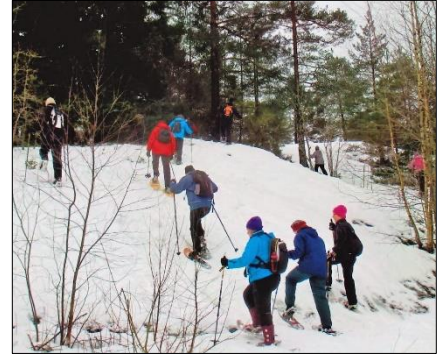
Kenkäilyä Kerttulassa 2015

Tapahtuma alkaa klo 10. Ohjattu lumikenkäretki (n. 2 tuntia) sisältää lumikenkiin tutustumisen ja rauhallista kävelyä poluilla ja polkujen ulkopuolella Tikanmaan metsässä. Omia lumikenkiä ei välttämättä tarvitse olla. Hankimme niitä tarpeen mukaan. Kenkäilijöille valmistuu myös nuotioruokaa.