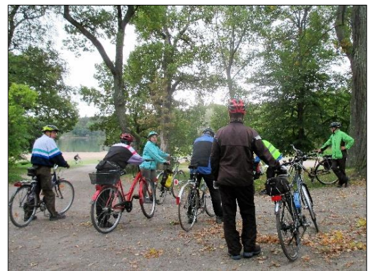
Pyöräilijät tauolla Ruissalossa