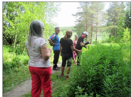
Villiyrttikävelyllä 17.6.2017 maisteltiin mm. maitohorsman makua