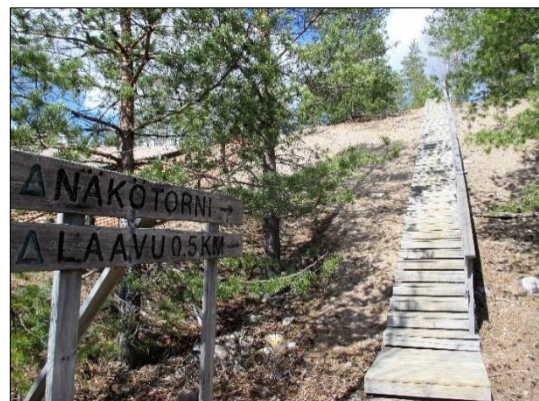
Portaita harjulle kevätauringossa 2017