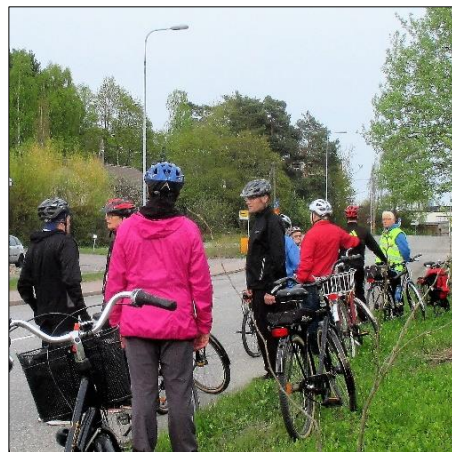
Pyöräilijät tauolla matkalla Ruissaloon 22.5.2017