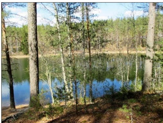
Hevonlinnan järvi keväällä 2017

Lisätietoja: http://koski.fi/palvelut/hevonlinnan_alue- ja_latukartta//