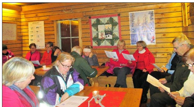
Laulajia vuoden 2016 puuroretkellä majassa.

Ilmoittautumiset ja tiedustelut pe 8.12. mennessä s-postilla rinkka@raisiorinkka.fi tai puhelin 044 080 2430 Kaija