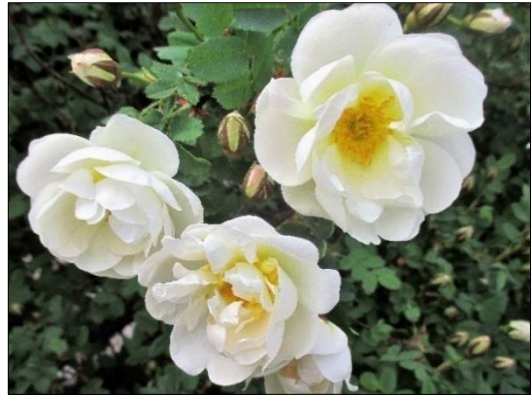
Juhannusruusut kukkivat 20.6.2017