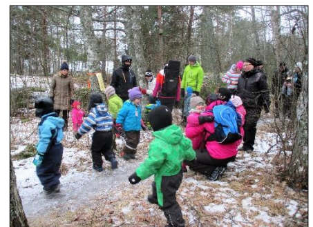
Osallistujia Metsämörri-retkellä 4.2.2017

Mieleenpainuva kokemus on pienestä pojasta, joka metsämörriretken jälkeen halusi äitinsä kanssa metsään ja sai metsämörristä hajujäljen ja näki sen jalanjälkiä. Herätetään meissä aikuisissakin tuo lapsen uteliaisuus, ilo ja aitous. Nautitaan vielä olemassa olevasta kesästä luonnossa liikkuen ja unelmia toteuttaen, ladataan akkuja talven varalle.