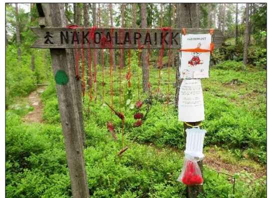
Kädentaitoja opetti pikkumyy – syntyi tuulikello