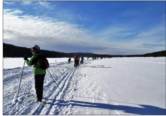
Kesänkijärven jäällä vuoden 2017 retkellä hiihtäjiä

Majoitumme Raitismajassa, Nilivaarassa 2-4 hengen huoneissa täysihoidolla. Sauna on käytettävissä päivittäin.