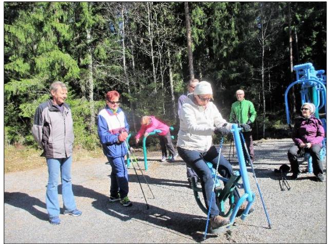
Tiistaikävelijät testaavat välineitä Kuloisten lenkillä 2.5.2017

Tämän jälkeen kävelyt jäävät joulutauolle.