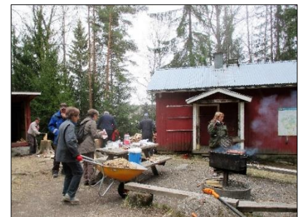
Talkoissa puuhaa ja ruokaa 2017

Majalla sinulla on mahdollisuus saunomiseen.