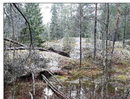
Maisema 12.11.2017 Rinkan Metsämieli tapahtumassa