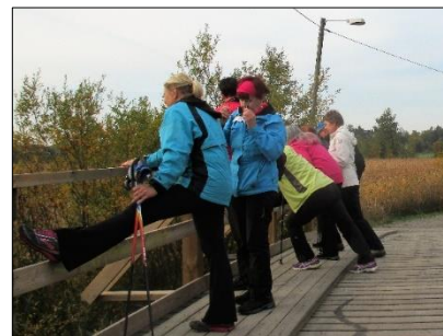
Tiistaikävelijät venyttelevät Uikkupolulla.

Löydät lähtöpaikat www.raisionrinkka.fi sivuilta – tai kirjaa lähtöpaikat kalenteriisi.