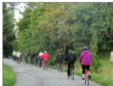
Pyöräilijät 28.8.2017 Ruissalossa

Tule mukaan tutustumaan lähialueen pyöräteihin ja maisemaan. Vauhti säädellään osallistujien mukaan kuntoilu- ja retkeilynopeudeksi. Polje ja näe!