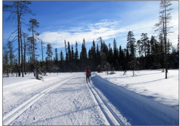
Vuoden 2017 retkellä hiihtäjiä

Armonlaakson Vaeltajien ja Raision Rinkan yhteinen ensi talven 2019 hiihtoviikko Lapissa suuntautuu Yllästunturin maisemiin. Majoitumme Raitismajassa, Nilivaarassa 2-4 hengen huoneissa täysihoidolla. Sauna on käytettävissä päivittäin. Lisäksi on tarkoitus tehdä retki johonkin lähikohteeseen osallistujien kiinnostuksen mukaan.