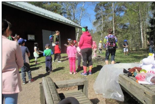
Leikkejä ja liikuntaa 10.5.2018 Friisilässä

Olemme ulkona. Pukeudu sään mukaan. Rinkka tarjoaa osallistujille lämmintä mehua.