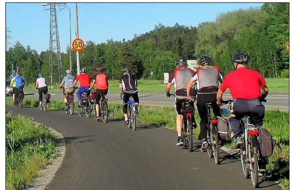
Pyöräilijät 28.5.2018 polkevat –' vauhti on alle 50'

Vauhti säädellään osallistujien mukaan kuntoilu- ja retkeilynopeudeksi.