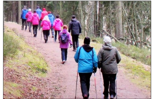
Tiistainkävelijät lenkillä 24.4.2018

Tämän jälkeen kävelyt jäävät joulutauolle.