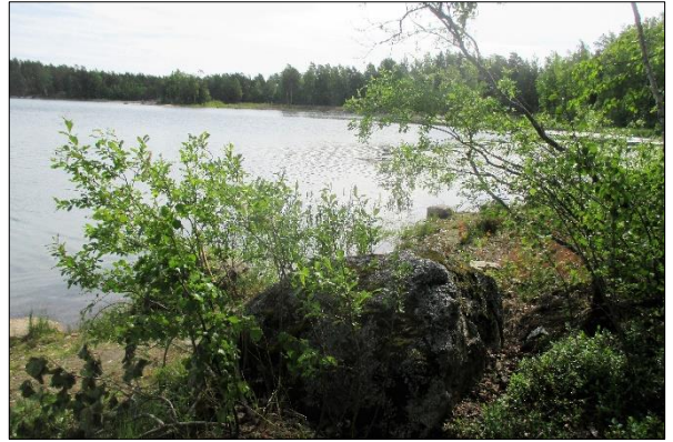
Haunisten allas 7.5.2018

On ihana huomata, että luonnossa liikkumisesta on tullut vähän kuin ”muoti-ilmiö”. Nuoret aikuisetkin ovat löytäneet tiensä metsiin, puistoihin ja vesistöihin. On tullut puistojumppia, geokätköilyä, polkujuoksua. Meillä Rinkassa uutta on mm. maastopyöräily ja melonta.